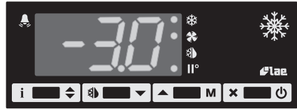
Abb. 1 - Bedienteil.